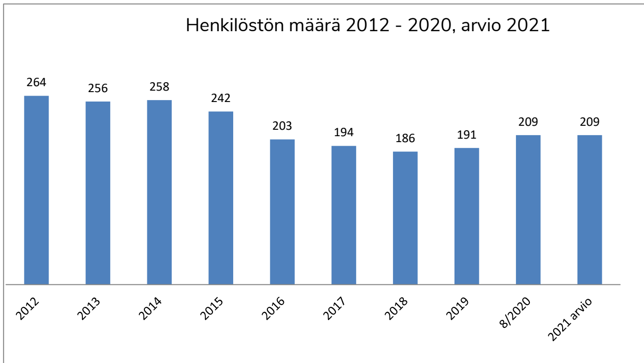
Taulukko 5 Henkilöstön määrä

Yhteiset palvelut: talous- ja henkilöstöhallinto, kiinteistöpalvelut, ruokapalvelut, tietotekniikkapalvelut, opintopalvelut eli opiskelijahallinto. Lisäksi organisaatioon kuuluvat laatu- ja kehittämisspalvelut.